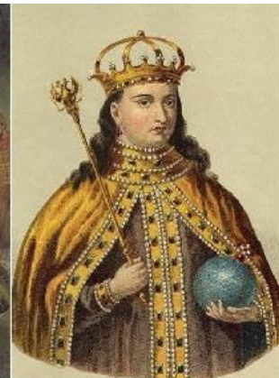
Царевна Софья Алексеевна