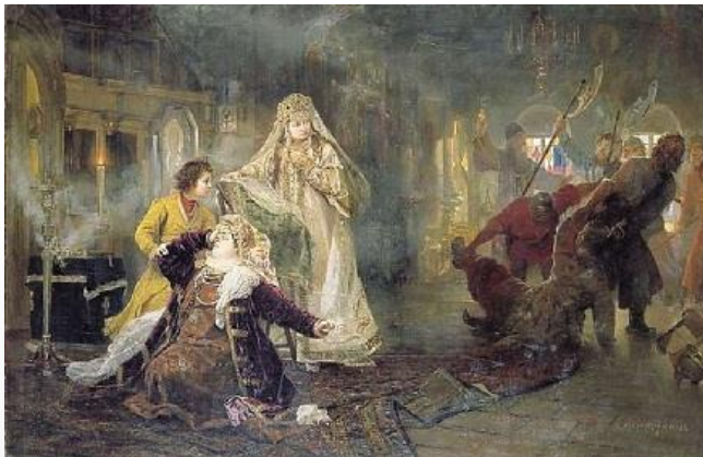
Стрелецкий бунт. Мятежники схватили Ивана Нарышкина

Приверженцы и родственники Нарышкиных подверглись репрессиям, Пётр I был венчан на царство вместе со сводным братом, Иваном V, в качестве младшего соправителя, а регентом при них стала родная сестра старшего царя, царевна Софья Алексеевна. В её правление Пётр вместе с матерью находился в отдалении от Двора в селе Преображенском. Лишь в 1689 г. ему удалось отстранить от власти царевну Софью, а в 1696 г., после смерти Ивана V, стать единодержавным царём.