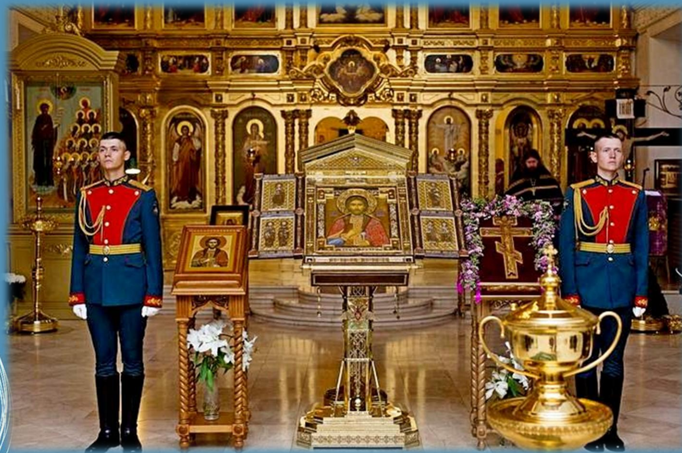
Образ Святого Благоверного Великого князя Александра Невского