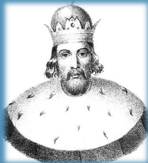
Князь Андрей III Городецкий