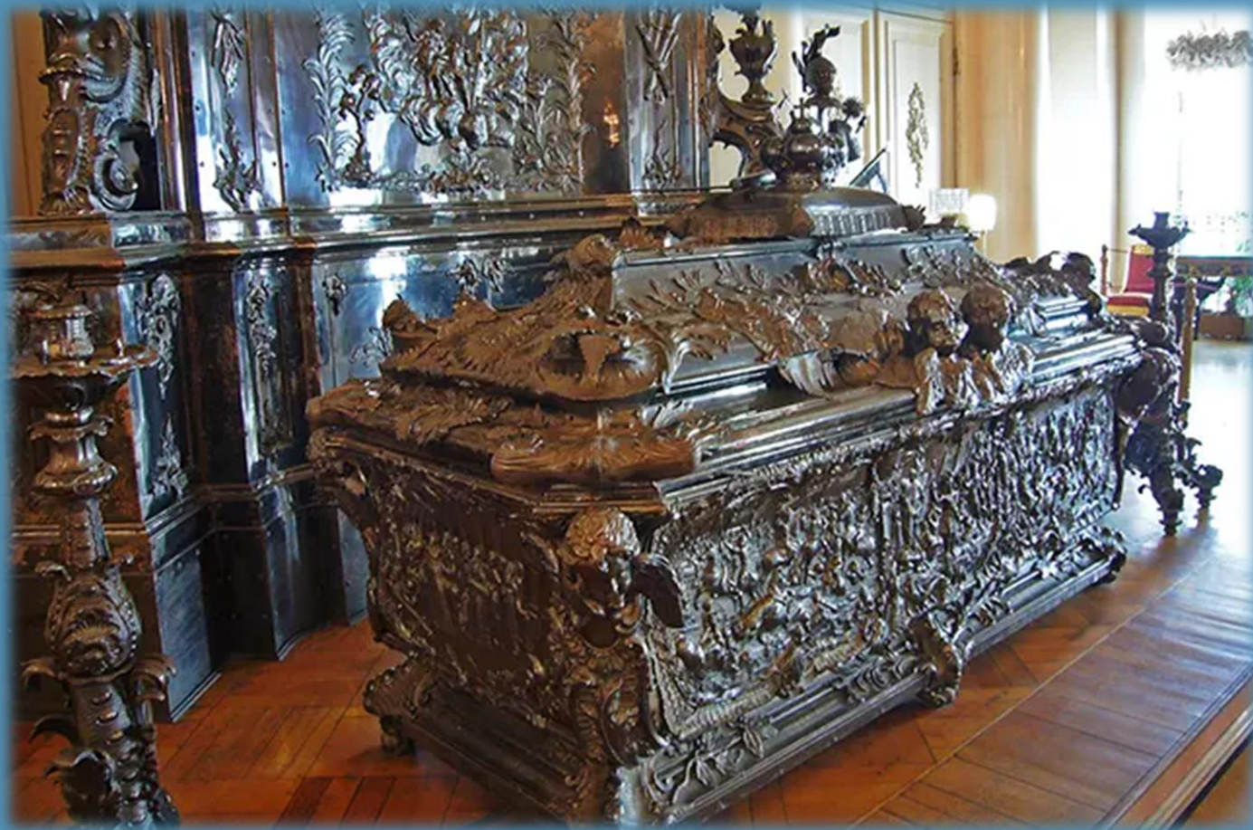
Саркофаг Александра Невского