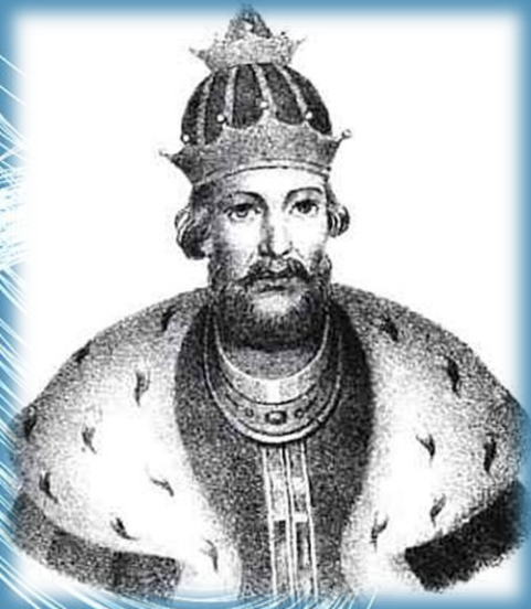
Князь Дмитрий I Александрович

Позже жена подарила Александру еще троих сыновей: Дмитрия, будущего князя новгородского, переяславского и владимирского, Андрея, который будет костромским, владимирским, новгородским и городецким князем, и Даниила, первого князя московского. Также у княжеской пары была дочь Евдокия, которая впоследствии вышла замуж за Константина Ростиславича Смоленского.