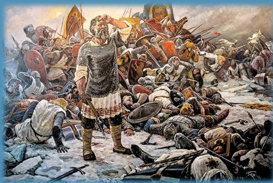
Битва при Чудском озере

Пока передовые отряды ливонцев пытались пробить плотный строй новгородской пехоты, княжеские дружины оставались на месте. Вскоре дружинники ударили по флангам неприятеля, сокрушая и смешивая ряды немецких войск. Новгородцы одержали решающую победу.