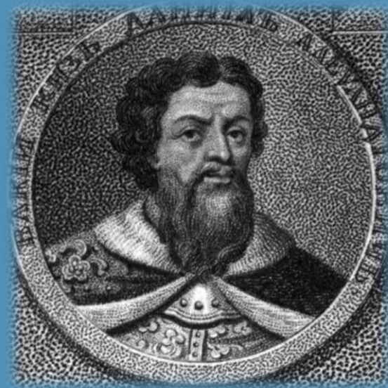
Князь Даниил Александрович