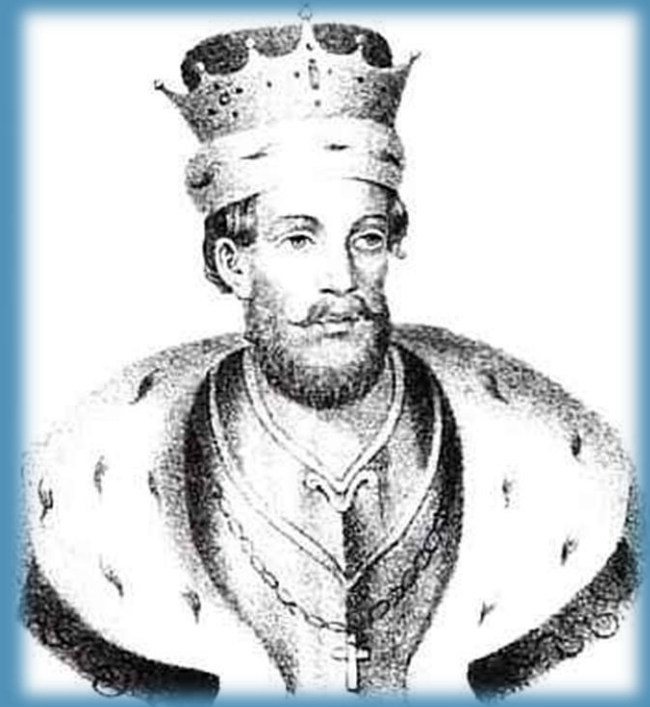
Князь Василий I